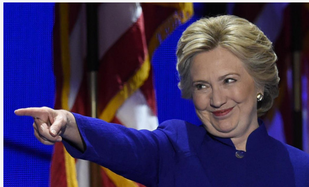
Hillary Clinton.