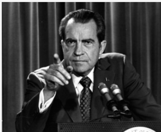
President Nixon.