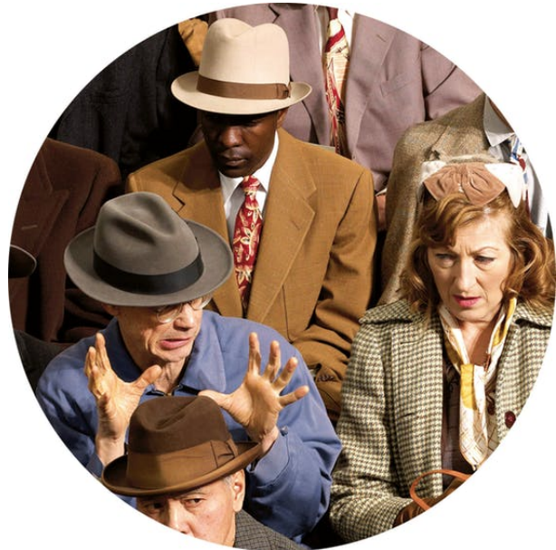
Uitsnede uit Stan Douglas, Hastings Park, 16 July 1955 (2008) Collectie museum Voorlinden, Wassenaar.

Dat betekent dat Amerikaan worden iets wezenlijk anders is dan Fransman, Duitser of Nederlander worden. Amerikaan zijn heeft iets rationeels, iets contractueels, terwijl Europese landen een vaag soort cultuurgemeenschap vormen. Onze grondwet werkt anders dan de Amerikaanse. Vrijwel niemand weet wat erin staat. Paul Scheffer schreef onlangs in de NRC over zijn behoefte aan een nieuw 'sociaal contract', maar formuleerde dat zo vaag dat hij zich een uitstekende Nederlander betoonde.