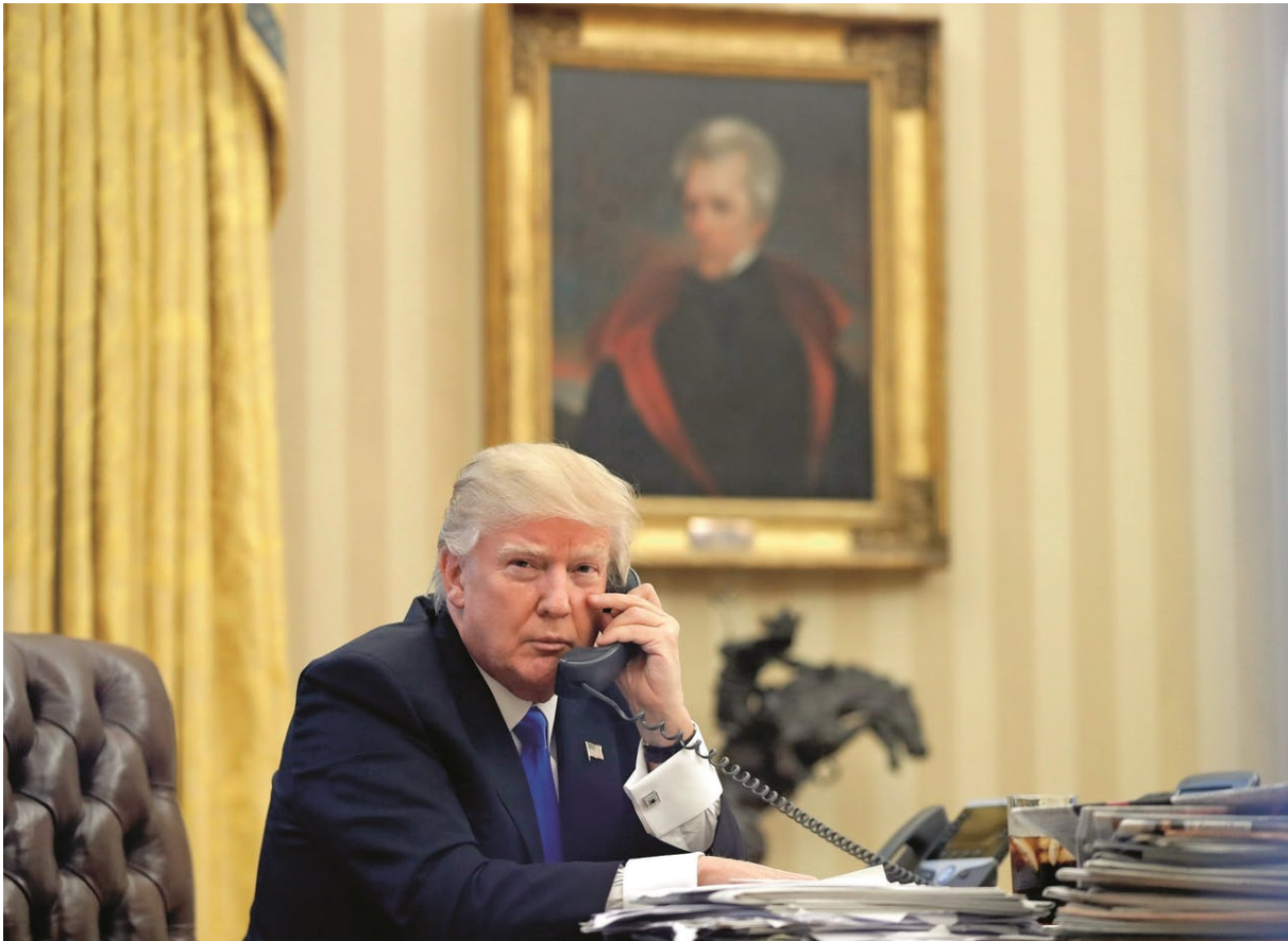
Donald Trump in januari 2017 in het Oval Office, met op de achtergrond een portret van Andrew Jackson.

faillissementen achter, Jackson deed wat hem uitkwam en liet doden achter.