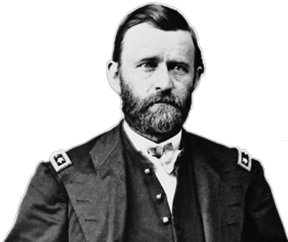
21. Ulysses S. Grant (1869-1877)