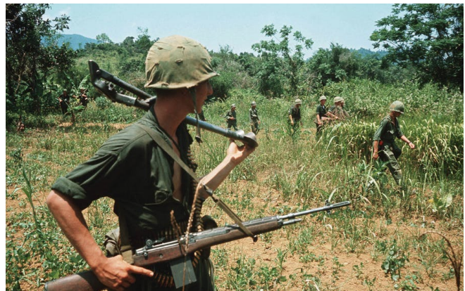
Amerikaanse soldaten op patrouille in 1965.

Steeds als ik in Washington ben, ga ik langs bij het monument. En iedere keer weer ben ik onder de indruk. De veteranen die er rondhangen en hun verhalen