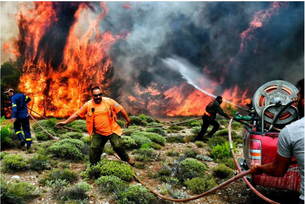
Brandweerlieden en vrijwilligers proberen het vuur te bestrijden in de buurt van Kineta, bij Athene.

Het grote aantal slachtoffers bij de hevige bosbranden in de buurt van Athene wekt verbijstering en verontwaardiging in de Griekse media. Hoe kon het zo uit de hand lopen? De regering krijgt veel kritiek in de commentaren.