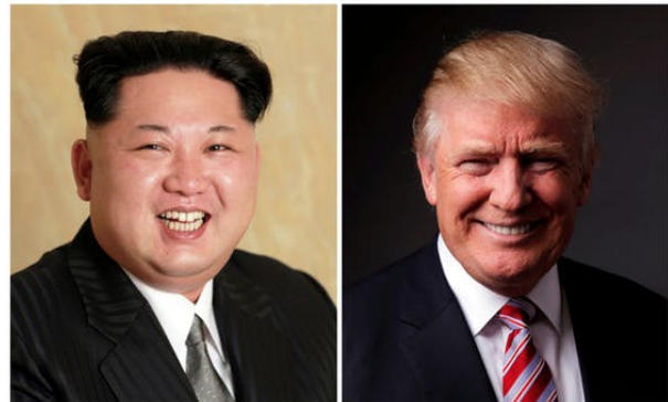
Trump geeft een groot cadeau aan Kim Jong-un: de status van wereldleider.

Het begint ermee dat Trump een groot cadeau geeft aan Kim Jong-un: de status van wereldleider. Kim hoefde alleen maar te beloven dat hij voorlopig niets zal ondernemen en dat veel bespreekbaar is, om zich te verzekeren dat hij als gelijke aan tafel zit met de Amerikaanse president.